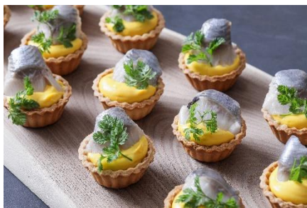
▲コーンウォール名物!ニシンパイ風タルト