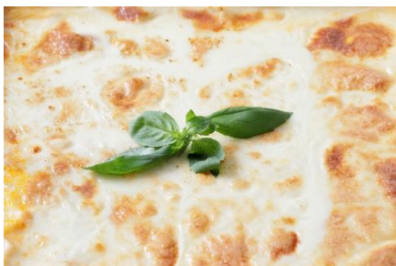
▲風の谷のラザニア 新芽の息吹