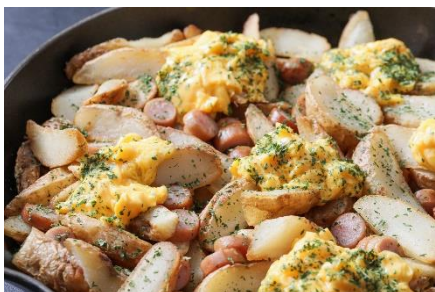
▲火の悪魔のエステルヤード(鉄板の上でフランベのパフォーマンスあり)