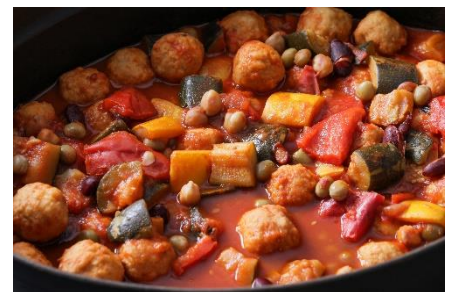
▲肉団子と野菜たっぷり!炭鉱街の煮込みスープ