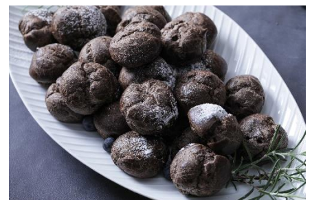
▲まっくらシュークリーム