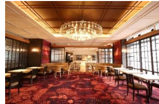
店舗内観 イメージ