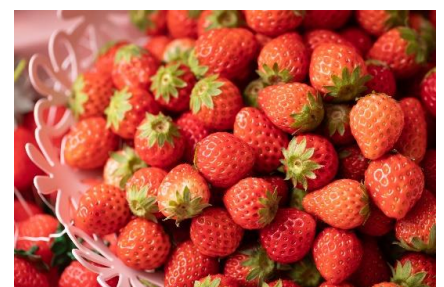
▲いちご好き必見！フレッシュいちご食べ放題