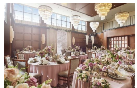
▲会場イメージ(オークルーム)