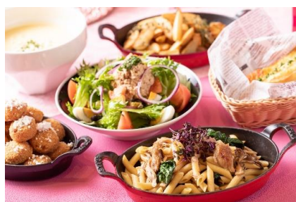
▲料理長特製の全6種のフードも提供