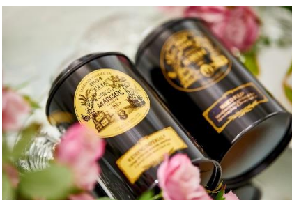
▲フランスの老舗紅茶も飲み放題