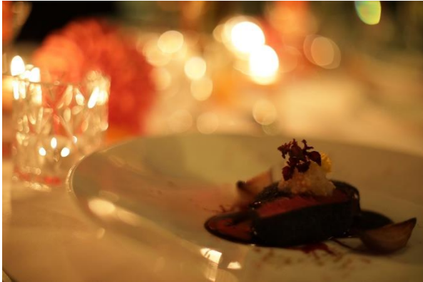
【01.レストランでお食事】