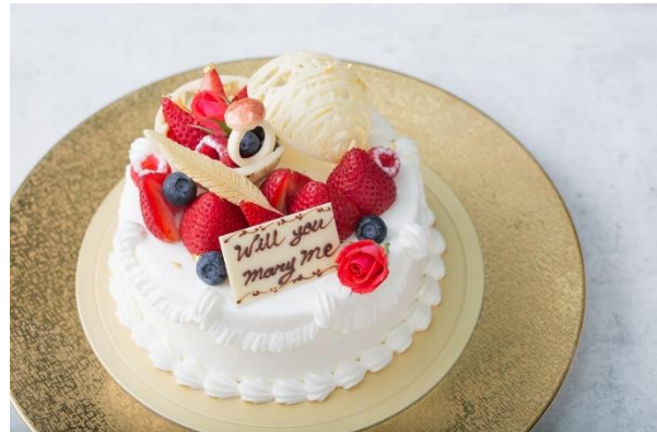
【04.レストランにてケーキでお祝い】

普段は入ることのできないチャペルをムービーの上映後にチャペルの扉が開くと花束を持ったプロポーズされる方が登場してプロポーズ! その後、プロのカメラマンによる記念撮影を行います。