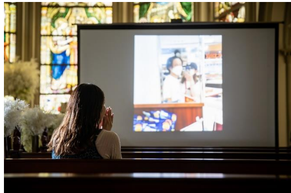
【02.チャペルで映像鑑賞】

お相手だけチャペルにご案内し、プロポーズされる方からのメッセージムービーを鑑賞。