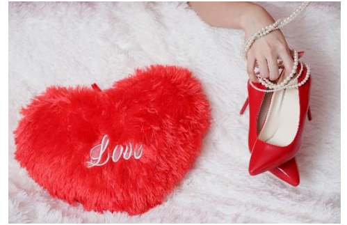
▲「Rouge Red Room」イメージ画像