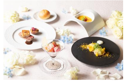
▲「ルームサービス」イメージ写真

story.ne.jp/ver3d/ASPP0200.asp?hidSELECTPLAN=A5HI3&hidSELECTCOD1=72460&hidSELECTCOD2=001&previewmode=true