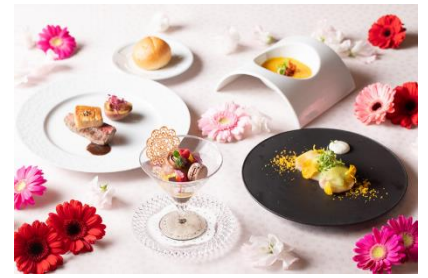
▲「ルームサービス」イメージ写真

story.ne.jp/ver3d/ASPP0200.asp?hidSELECTPLAN=A5HI3&hidSELECTCOD1=72460&hidSELECTCOD2=001&previewmode=true