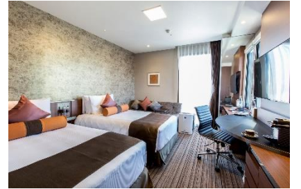
▲「個室」イメージ写真