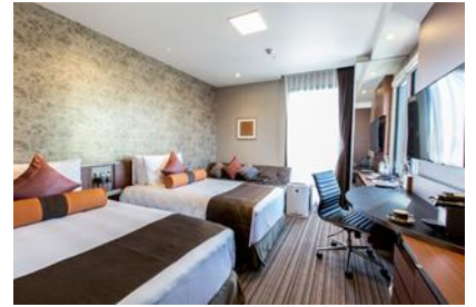
▲「客室」イメージ写真