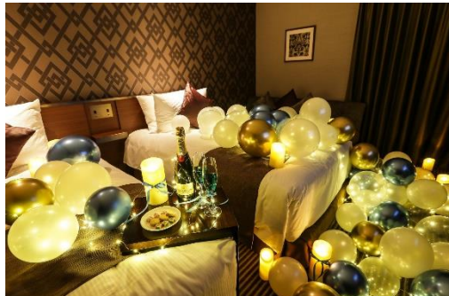
▲「バルーンデコレーションホワイトデーversion」 イメージ画像