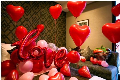
▲「バルーンデコレーションバレンタインversion」 イメージ画像