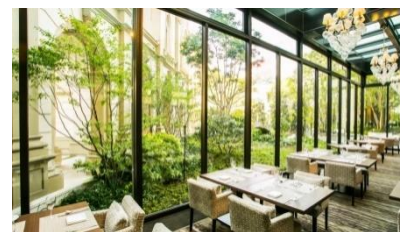
▲広々としたレストラン内観

◆◇本企画詳細・ホテルに関するお問合せ先◇◆ スtringsホテル 名古屋 広報担当: 関原/清水/岩田 TEL:052-589-0561/Fax:052-589-0563 E-mail: bb-pr@bestbridal.co.jp