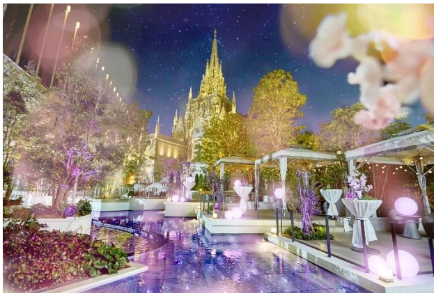
▲まるで夜桜見物に来たかのような幻想的な空間