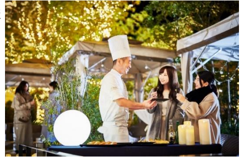
▲シェフ特製のフィンガーフードが並ぶ

■詳細URL: https://www.strings-hotel.jp/nagoya/