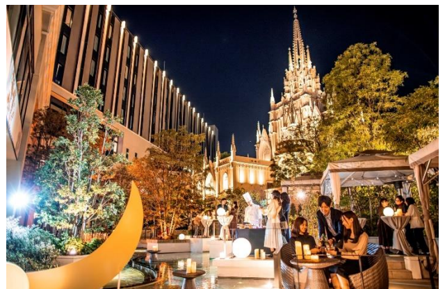
▲季節によって様々な企画を展開(左夏季: Water Night Cabana / 右秋季: Moonlight Cabana)