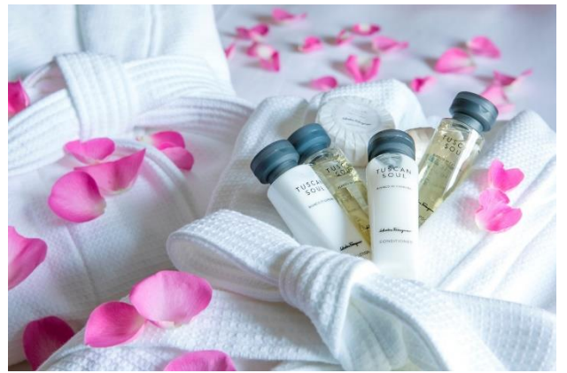
▲《特典》フェラガモのアメニティをプレゼント