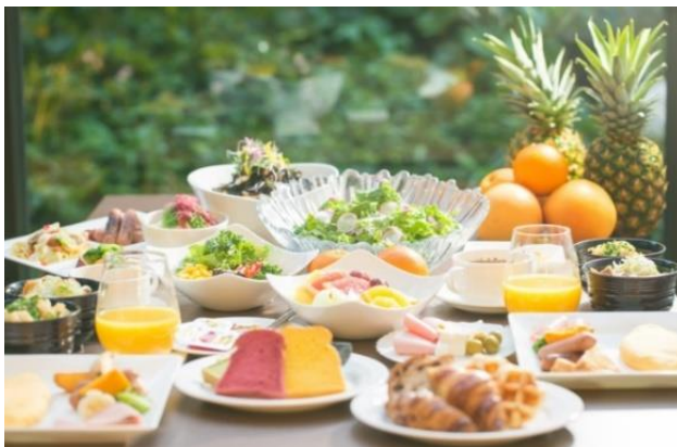
▲ヘルシー・ビューティー・フレッシュをコンセプトとした“シェフズライブキッチン”でのフルブッフスタイル朝食