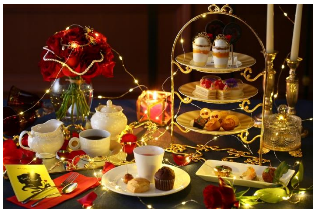
▲日が暮れてから楽しむアフタヌーンティーもおすすめ