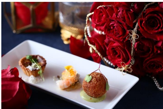
▲セイボリーは日替わりで3種をご用意

ドリンク フランスの老舗紅茶「マリアージュフレール」や日本茶フレーバーティー「おちゃらか」、挽きたてのコーヒーなど、約30種類の中からおかわり自由