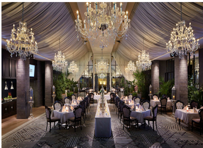
店内内観イメージ

「ヘルシー」「ビューティー」「フレッシュ」のコンセプトのもと、新鮮な野菜やオリーブオイルをたっぷり使って優しい味に仕上げたニューヨークスタイルのヘルシーイタリアンダイニング。時間帯ごとに表情が変わるスタイリッシュな店内で提供するヘルシーイタリアンは、フルコース“プリフィックススタイル”や“ライブメランジェサラダ・オードブル・スープ ブッフェ&プリフィックスコース”（ランチのみご提供）など、多彩なスタイルをご用意しています。