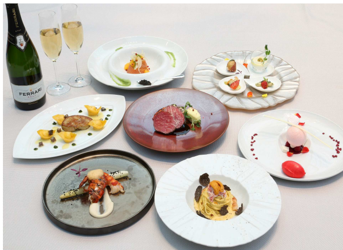
コース料理イメージ

店名：ヘルシーイタリアンダイニング「ジリオン」 住所：〒453-0872 愛知県名古屋市中村区平池町4-60-7 1F 営業時間：ランチタイム 11:00～15:00(L.O.14:00) ディナータイム 17:30～22:00(L.O.21:00) 電話番号：052-589-0577(代表) 定休日：不定休 HP： http://www.strings-hotel.jp/nagoya/restaurant/zillion/index.html 料金：税金、サービス料(12%)別