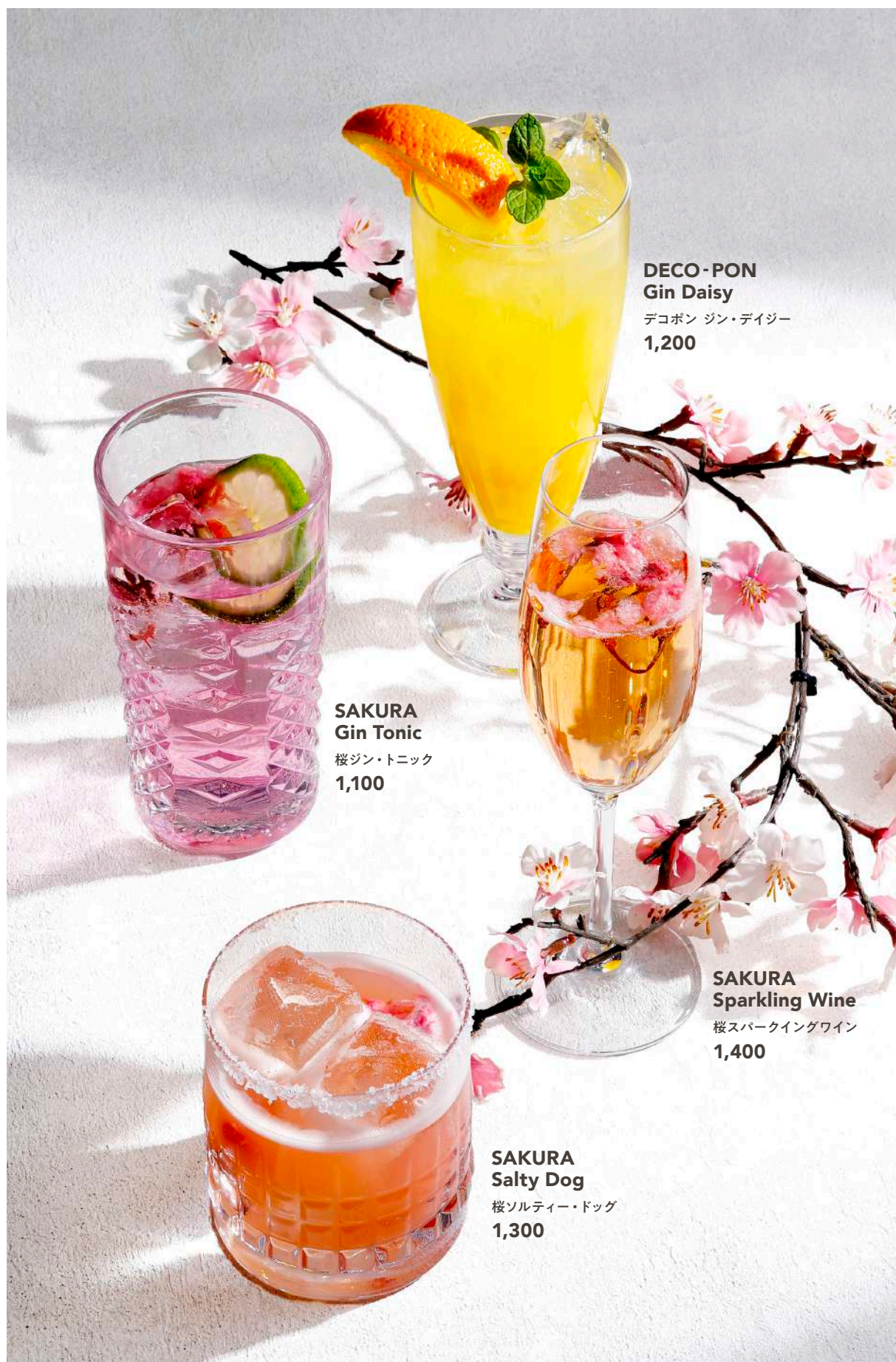
DECO-PON Gin Daisy デコボン ジン・デイズー 1,200