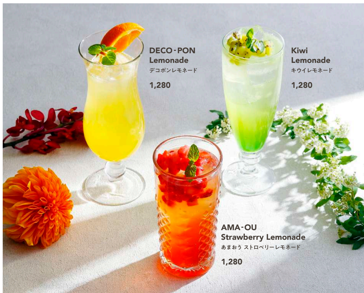
DECO-PON Lemonade デコポンレモネード 1,280