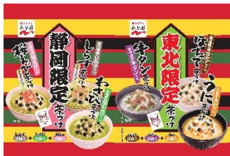
▲永谷園:地域限定茶づけ(東北限定・静岡限定)