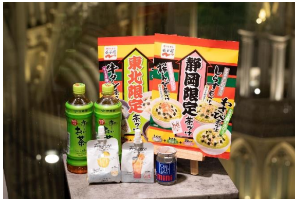
▲ギフトアメニティ