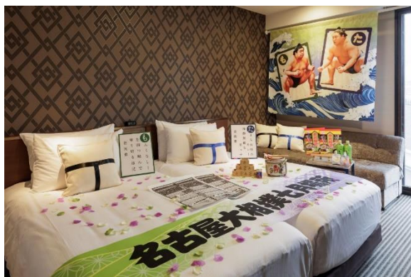
▲“若元春&若隆景”デコレーションルーム