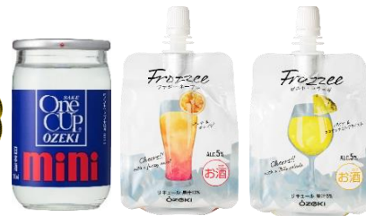
▲大関:「ワンカップミニ」100ml(鏡開き用1本)・ 日本酒ベースのフローズンカクテル 「Frozsee ファジーネーブル&ピニャコラーダ」